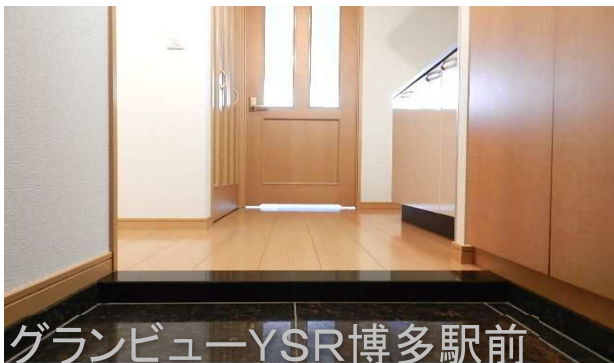
グランビューYSR博多駅前