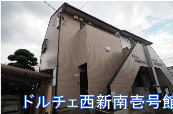
ドルチェ西新南壱号館