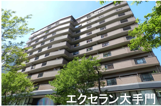
エクセラン大手門